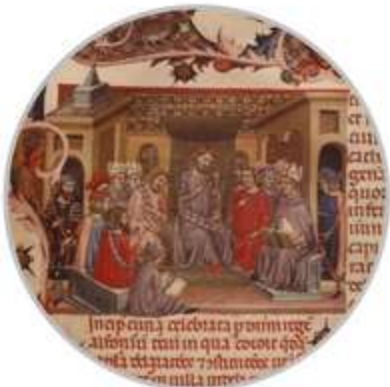
Miniatura que representa el rei Alfons I (1154-1196) presidint una assemblea de pau i treva (còdex dels Usatges)