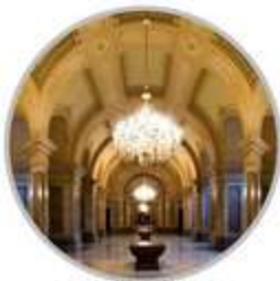
El Saló de Passos Perduts