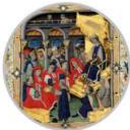
Història de la institució parlamentària