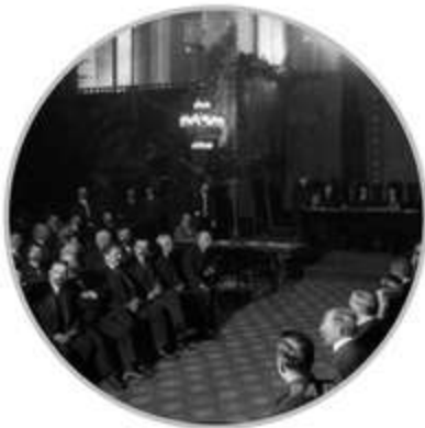
Enric Prat de la Riba en ser proclamat president de la Mancomunitat de Catalunya en una assemblea constituent al Saló de Sant Jordi del Palau de la Generalitat, seu de la Diputació de Barcelona.