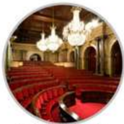
El Saló de Sessions