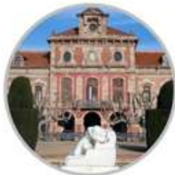
Visita al Palau