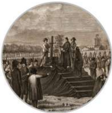
Execucions de ciutadans barcelonins dutes a terme a la ciutadella el juny del 1809 en el marc de la repressió exercida per les tropes franceses a Catalunya.