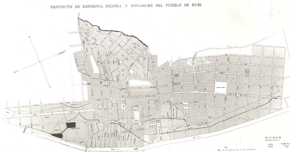
Plànol de 5 de juny de 1875

De la mateixa manera que en d'altres poblacions, la segona meitat del segle veié la construcció de zones d'eixample. A Barcelona, el 1854 es va autoritzar l'enderrocament de les muralles i el 1860 es va posar en marxa el pla d'Ildefons Cerdà. Cerdà concebia una ciutat sense segregació social, per la uniformitat del traçat, encara que la realitat va ser diferent i la zona es va consolidar com un barri fonamentalment burgès. En la mateixa època es van realitzar altres eixamples com els de Terrassa o Sabadell, molt influïts pel de Cerdà. Gairebé al mateix temps, a Rubí es dissenyà una gran expansió per les terres del Nord i de Migjorn. Era un Rubí en creixement, capaç d'elaborar el “ Proyecto de Reforma, Mejora y Ensanche del pueblo de Rubí ”, veritable primer Pla d'Ordenació Urbana, l'any 1873-74. De quadricula, similar a l'Eixample Barcelonès, significa una ordenació racional, amb carrers que ja preveïen les futures vies de comunicació. Per les terres de la Marquesa de Moià, al Nord, amb un carrer de Pau Claris, que havia de ser d'una amplada tres vegades superior a l'habitual en els carrers de Rubí per tal de permetre arribar les noves carreteres que ja es preveïen (Rubí a Molins de Rei i a Sabadell, i Gràcia Manresa) i per Migjorn, a redós d'una ampla plaça que havia d'anomenar-se del Progrés i que mai va veure la llum.